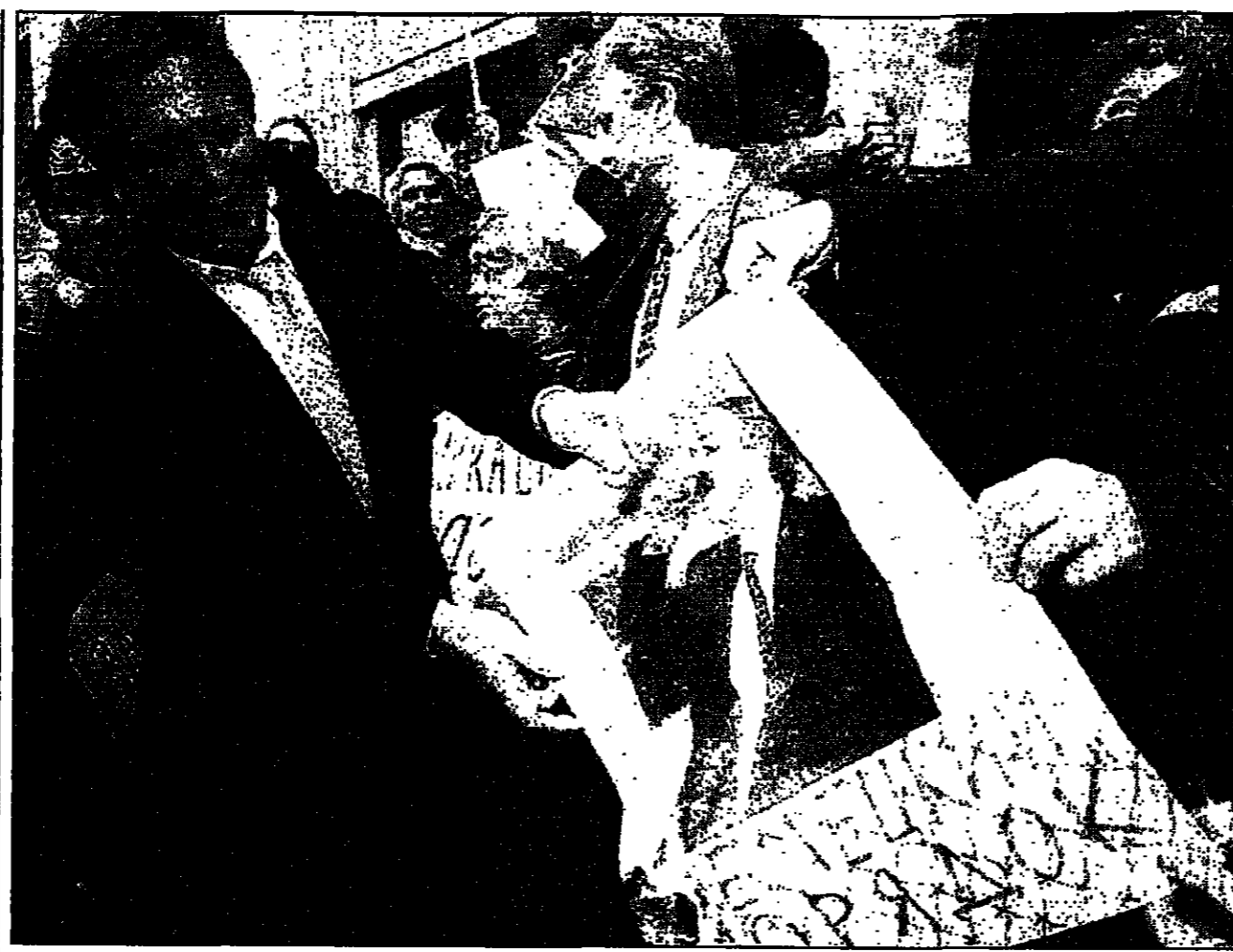
مجلس الوزراء في موسكو يقر دعمه لروسيا في اتفاق الوحدة مع روسيا

لندن - رئيس الوزراء البريطاني، توني بلير، أكد في مقابلة مع صحيفة «نيويورك تايمز» أن خفض الضرائب يتصدر تعهدات البرنامج الانتخابي لحزب المحافظين. وقال بلير، إن خفض الضرائب يتصدر تعهدات البرنامج الانتخابي لحزب المحافظين.